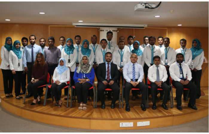
ޖަލްޞާޔާ ގެޒެޓް ގައި ބަޔާންކުރި ގޮތުގައި ހިއްސާތަކާ ބެހޭ ގޮތުން ޖަލްޞާޔާ ގެޒެޓް ގައި ބަޔާންކުރި ގޮތުގައި