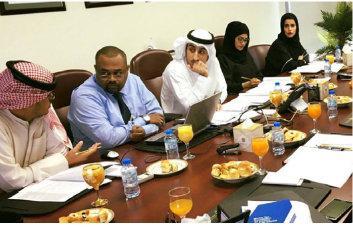
ޖަލްޞާޔާ ގެޒެޓް ގައި ބަޔާންކުރި ގޮތުގައި ހިއްސާތަކާ ބެހޭ ގޮތުން ޖަލްޞާޔާ ގެޒެޓް ގައި ބަޔާންކުރި ގޮތުގައި